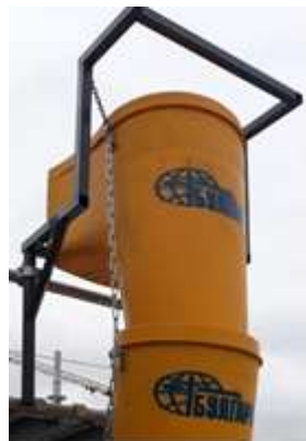
Рамка за окачване